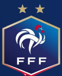
TABLEAU DU 1 ER TOUR